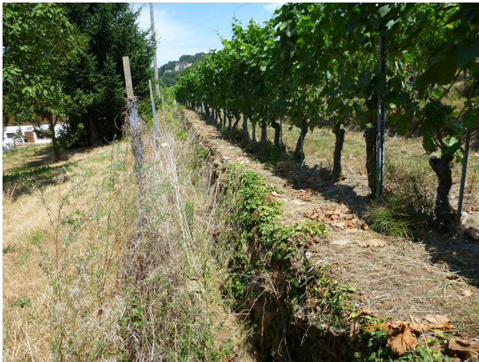
Photos de l'objet 22.07.2015